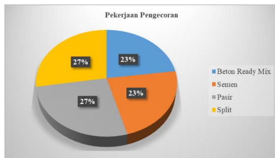
Gambar 7. Diagram Persentase Sisa Material Pekerjaan Pengecoran